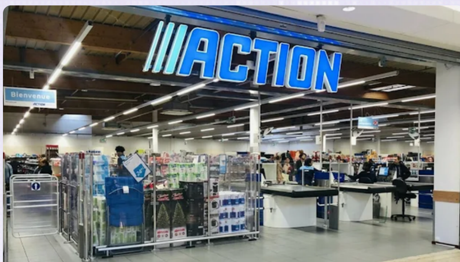
Action Lille Lillenum